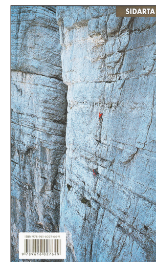
V Stebru Franca Jožefa